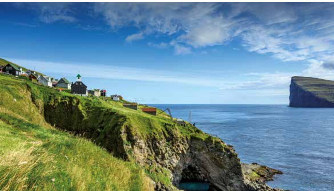
Kirkja. Eysturhøvdi á Svalöyinni í baksýni.

øðrum bygðum – eisini úr Hattarvík – og fylltu tómrúmini á Kirkju. Í 1925 búðu heili 148 fólk á Kirkju - tað mesta nakrantíð, og í 1933 fekk bygðin aftur nýggja kirkju á sama staði, har gomlu kirkjurnar høvdu staðið. Í nýggjari tíð hevur tað eisini verið Kirkja, ið fostraði stór skøld og politikarar. Hon fekk eisini skúla í 1888, meðan Hattarvík ikki fekk sín skúla fyrr enn í 1925.