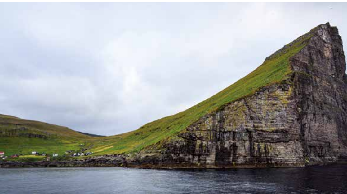
Hattarvík. Eystfelli til hægru á myndini.