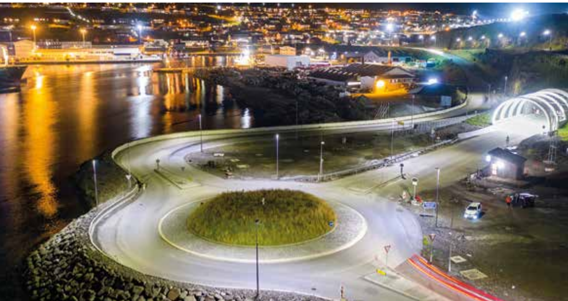
Tunnilmunninn við Saltnes.

tunnilin varð boraður, varð umfangandi vegagerð gjörð við tunnilmunnarnar.