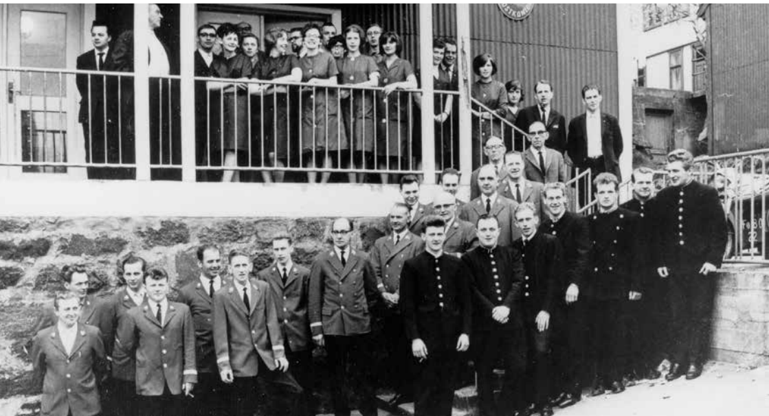
Starvsfólkini á posthúsinum í Havn í 1960unum

Reyði postjakkin varð bara nýttur í Havn. Í landinum annars var jakkin svartur.