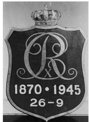
Gamalt postskelti á posthúsinum í Havn