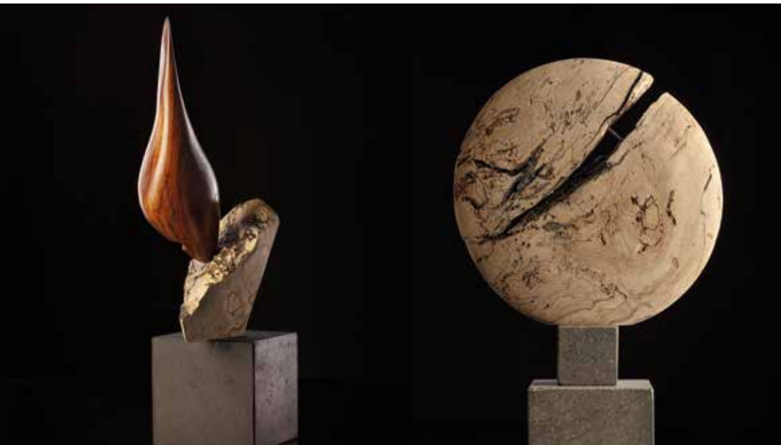
Tvær skurðmyndir: Round my Edges og Full Circle.

Tá hann gjørdi undankanningar til hesa verkætlan, tosaði Cole við fleiri enn 50 tilflytarar í Føroyum. Hann savnaði saman teirra hugsanir og legði tær afturat sínum egnu upplivingum av, hvussu tað var at laga seg til eitt lív so langt burturi frá upprunliga heimstaðnum. Hesi evni, sum komu fram í samrøðum, vóru við til at evna hugskotið aftanfyrir hvørja einstaka skurðmynd.