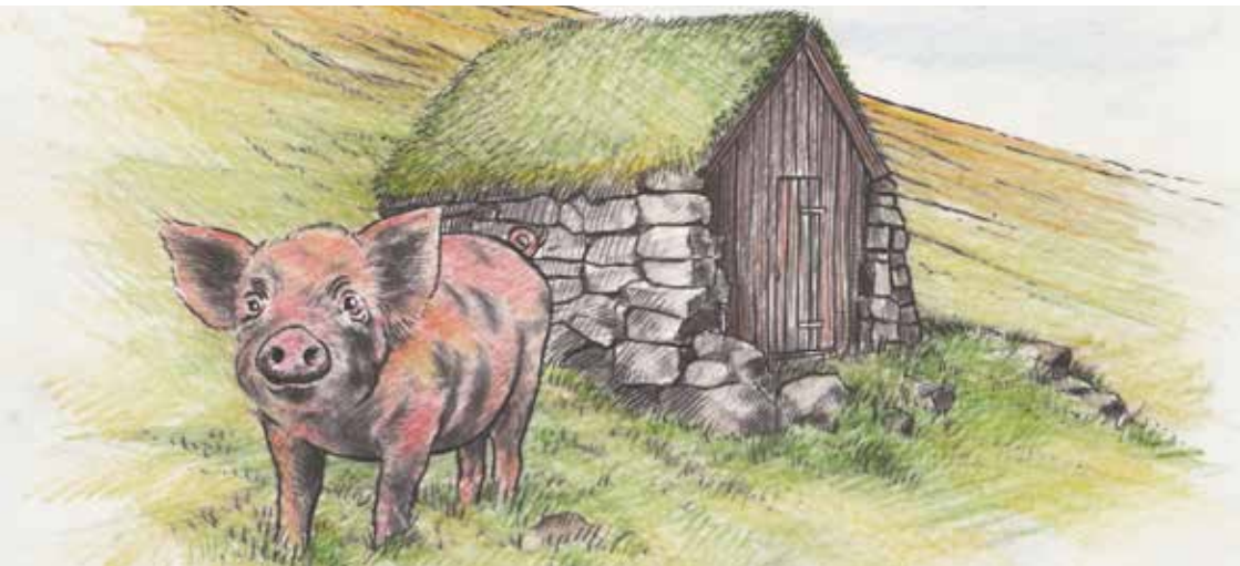
Tekning: Martin Mörck

urin kom upp við fregattini Gefion, og við sær hövdu teir nakrar livandi grísar til feskan proviant.