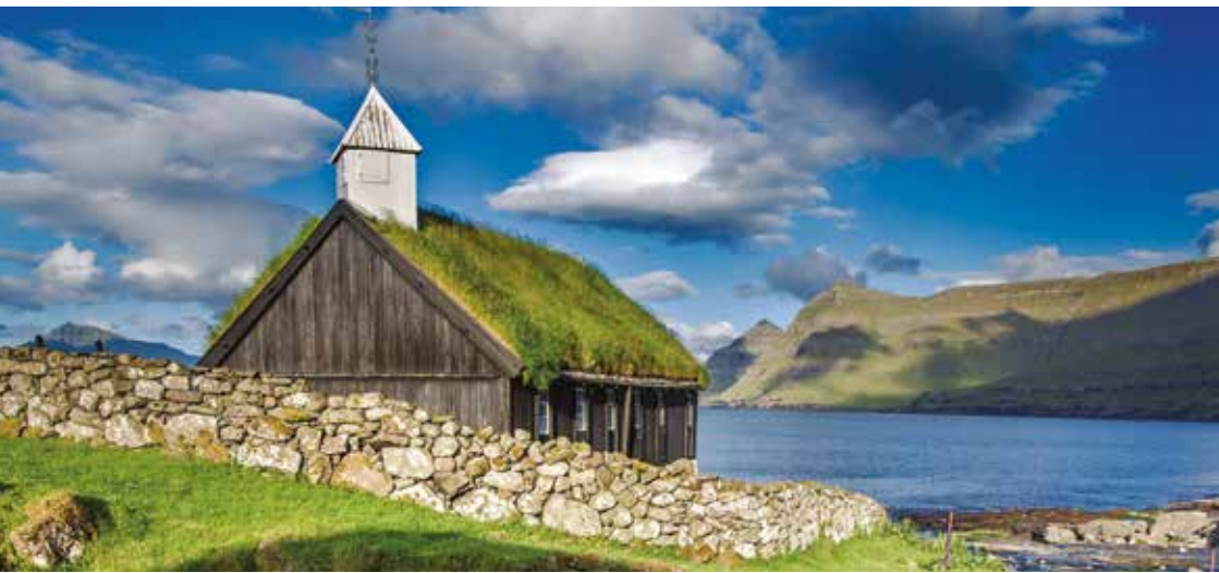
Funnings kirkja.