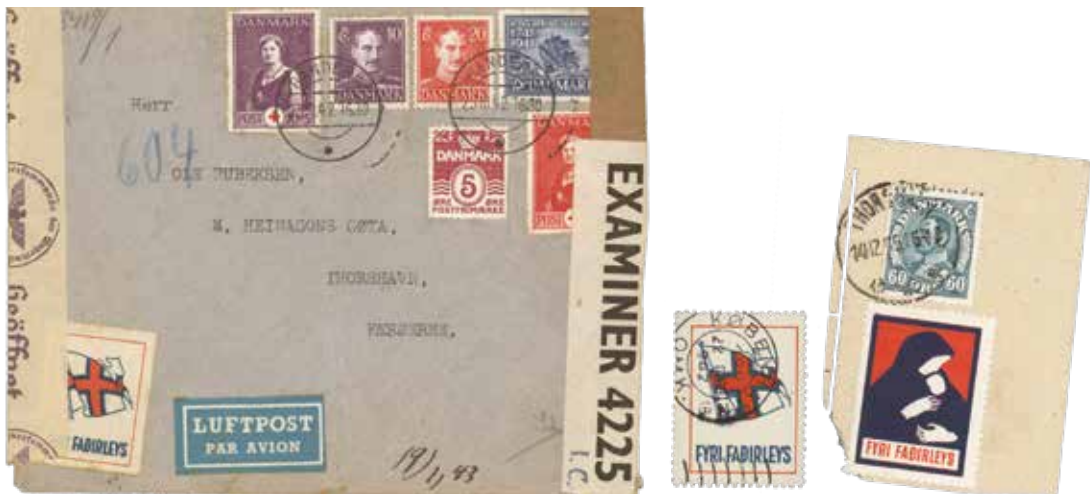
Bræv úr Danmark til Føroya, latið upp av týska sensurinum og brævklipp av merkjunum Fyri faðirleys.