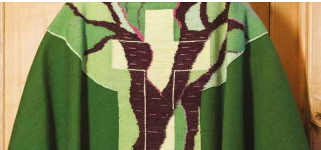
Messuakulin í Funnings kirkju.

úr floyali og við gyltum krossi aftan og einum ella tveimum gyltum bordum runt um kantin verið soatsiga í øllum kirkjum. Teirelstu messuaklarnir, sum eru í kirkjunum, eru frá 1890-árunum og frá umleið ár 1900 og frameftir. Nakrir teirra eru í nýtslu enn, og nógvastaðni vita tey ikki, hvussu gamlir teir eru. Tað er Dansk Paramenthandel, stovnaður í 1895, sum hevur gjørt nógvar messuaklar til føroysku kirkjurnar. Skrásetingin visir ongær broytingar í messuaklum fyrr enn í seinnu helvt av 20. øld. Christianskirkjan, sum er vígd í 1963, fær í 1970-árunum ein grønan messuakul úr brokadetilfari, og er tað Dansk Paramenthandel, sum hevur gjørt hann. Vesturkirkjan, sum er vígd í 1975, fær messuaklar í øllum fyra litunum í kirkjuárinum. Tann grøni og tann reyði eru gjørdir í Danmark. Tann hvíti og víólblái eru gjørdir í Onglandi.