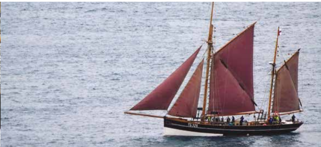
Jóhanna TG 326. Mynd: Ingi Sørensen

tørvurin var stórir á fiski til matna. Hetta var sera vandamikil sigling, mangt føroyskt skip gekk burtur hesi árin, orsakað av álopum frá týskum kavbátum og flogførum, ella tí at tey sigldu á eina minu. Í mun til fólkatalið, mistu føroyingar næstan líka nógvar menn í bestu árum, sum krígsførandi londini. Eftir annan heimsbardaga fór tíðin frá sluppunum. So hvørt sum tær vórðu tiknar úr vinnu, vórðu flestu sluppurnar søktar – og í dag eru bert nakrar heilt fáar eftir. Tvær av teimum eru myndevnið á hesum frímerkinum, Jóhanna TG 326 framman og Westward Ho TN 54 í baksýni. Bæðar sluppurnar eru 135 ára gamlar í ár.