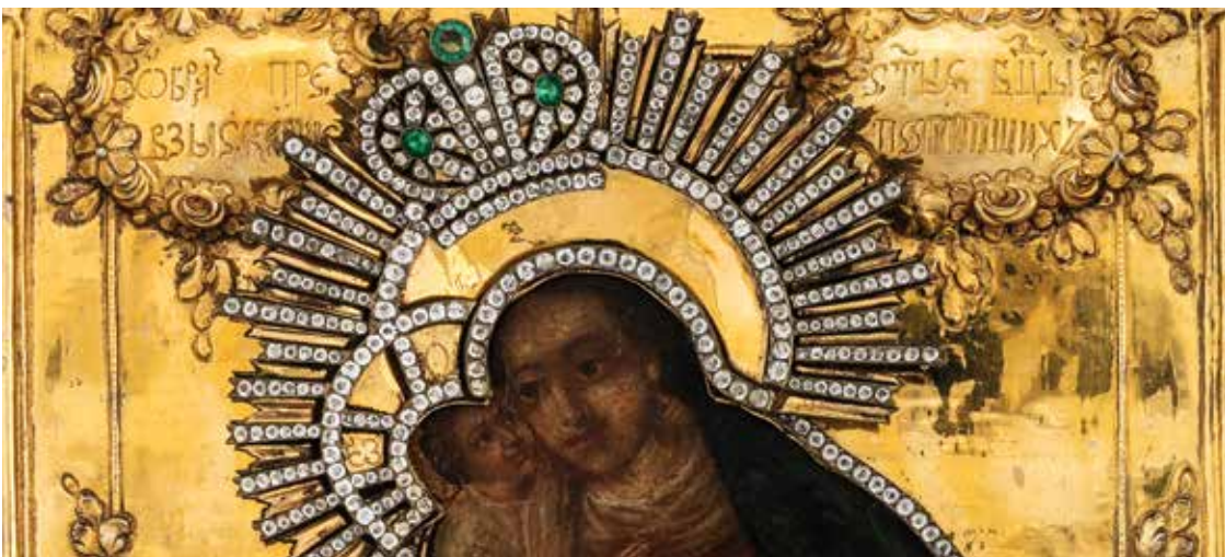
Gamalt russískur ikonur frá 1786 (halgimynd).

tað sýnir ikonurin tigandi" sigur kirkjufaðirin, Basilus hin Stóri.