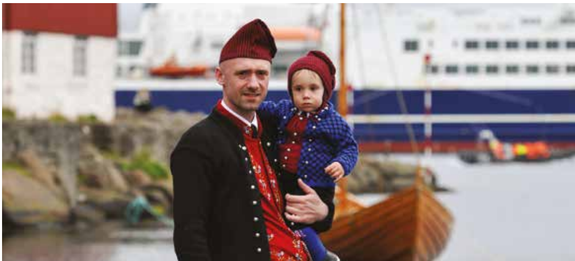
Maður og smádrongur í færoyskum klæðum