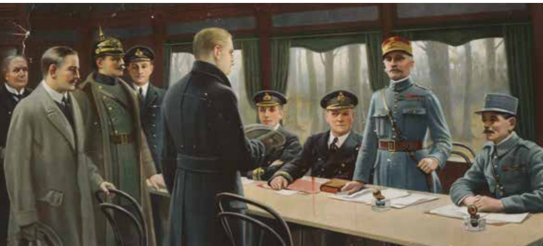
Málningur av samráðingunum millum týskarar og teir sameindu

troðka seg uml. 65 kilometrar inn á franskt øki.