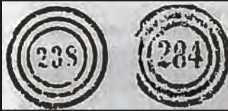
Mynd 6. Donsku poststemplini við numrunum 238 og 284