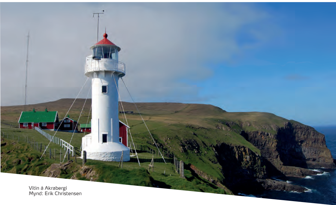
Vitin á Akrabergi

Vitin er ein sokallaður vinkulviti, ið lýsir hvítt, reytt ella grønt, alt eftir hvar man er staddur í mun til ljósið. Lanternan blunkar 5. hvørt sekund. Hvíta ljósið sæst 12 sjómíl, meðan reyða og grøna ljósið sæst 9 sjómíl. Vitin er tendraður frá 15. juli til 1. juni.