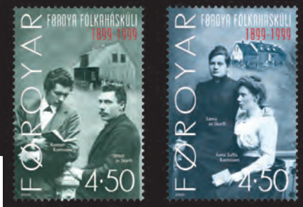
Mynd 11. Frímerki útgivin fyrri at hátíðarhalda 100 ára dagin hjá Fólkaháskúla Føroya.

av Bretum frá 12. apríl 1940 til 16. mai 1945.