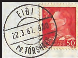
Mynd 10a + b. Tvey poststempel, ið vísa broytingina frá danska málinum (EJDE) til føroyska málið (EID).