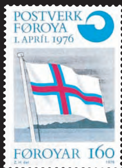
Mynd 9. Føroyska Merkið.