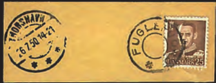
Mynd 7a + b. Tvey brævbjálvapetti. Eitt við poststemplinum KOLLEFJORD, og eitt annað við stjórnuvraveraða poststemplinum FUGLEFJORD.

Mynd 8. Frímerki, ið lýsa annan veraldarbardaga. Bretskir hermenn venja uttanfyri í Føroyum, og bretske hermenn spæla við børn á eini gøtu.