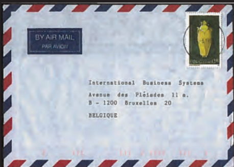
Mynd 12. Eitt bræv sent við flogposti av Toftum tann 24. mars 1995 til Belgia. Frímerkið er av fróðsprettni, ið er vanlig í Føroyum.