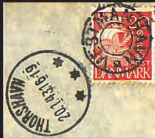
Mynd 13. Brævbjálvapetti við 20 oyra skipsfrímerki, sum kom út tann 25-10-1940 í Danmark, tá ið Danmark var undir týskari herðøku, og sum bleiv brúkt í Føroyum tann 20-01-1943, meðan Føroyar var hertikið av Bretum.

Donsku poststemplini vórðu í 1962 skift út við stempul, ið høvdu føroysk staðarnøvn. Strænder bleiv til dømis til Strendur, og Kvalbo bleiv til Hvalba (mynd 10a og b).