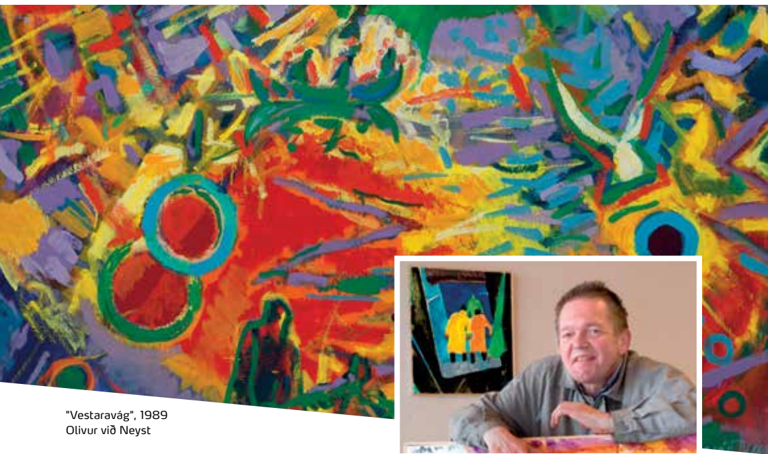
"Vestaravág", 1989 Olívur við Neyst