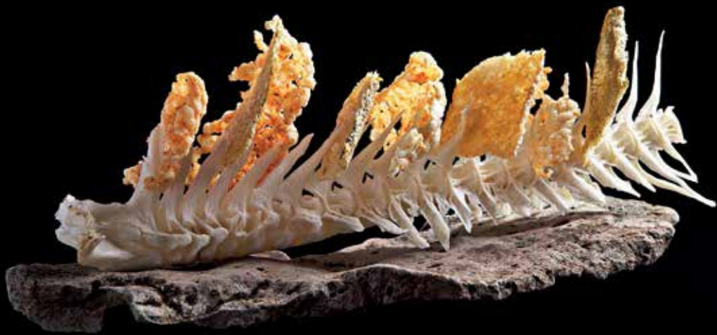
Turrfiskakíps og turr toskaskræða

hann fingið rætta mannin aftrat sær at fáa sagt søguna um burturkrógvaða føroyska rávøruparadísíð.