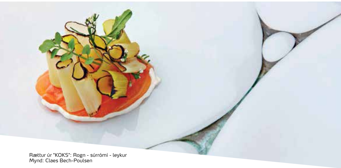
Rættur úr "KOKS": Rogn - súrrómi - leykur