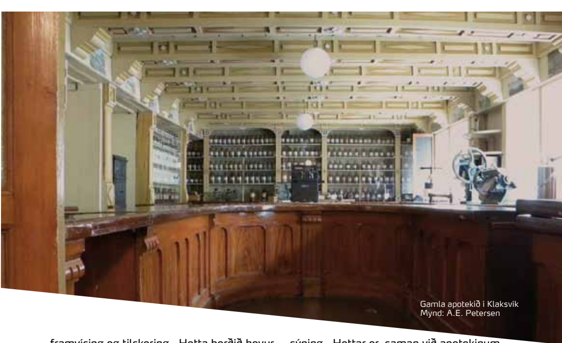
Gamla apotekið í Klaksvík

framvísing og tilskering. Hetta borðið hefur skuffur allan vegin runt, so plássið kundi nýtast til goymslu av smálutum. Eisini diskurin hefur hillar og skápshurðar til goymslu.