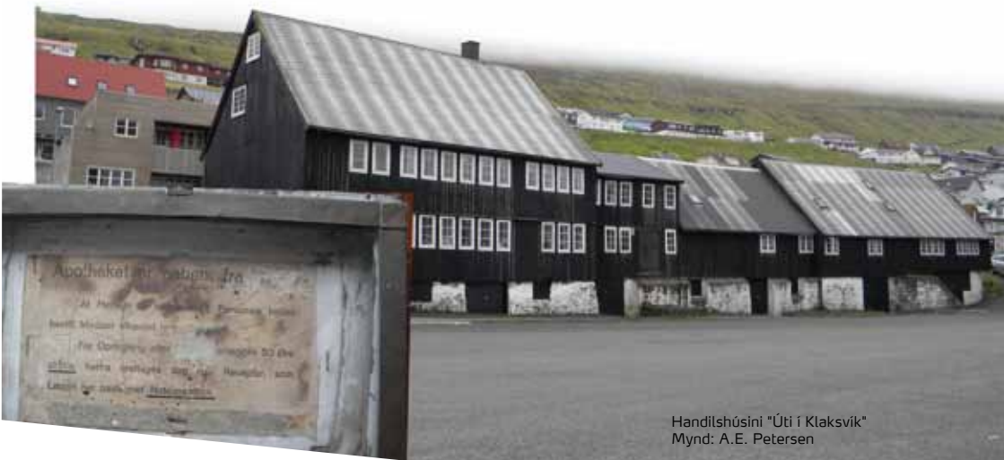
Handilshúsinu "Úti í Klaksvík"