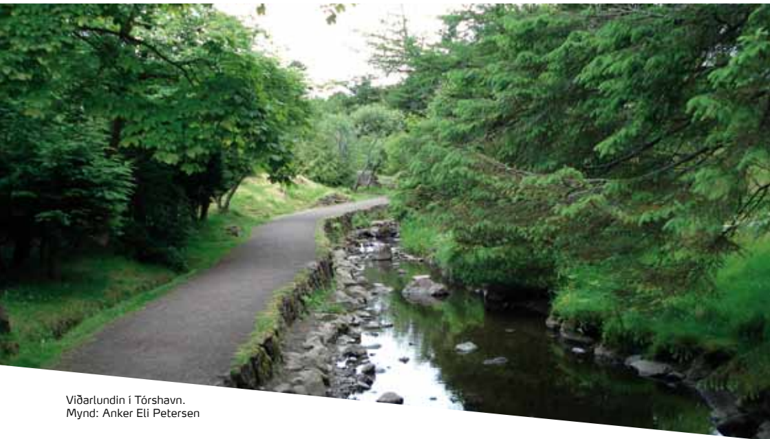
Viðarlundin í Tórshavn.

avgjørt ikki verið talan um. Í 1885 royndu menn at planta trø í størri vavi uttanfyri Tórshavn, men royndin miseydnaðist. Í 1903 royndu teir so aftur, og hesa ferð eydnaðist tað. Hetta varð til tað vit í dag rópa Viðarlundin ( Plantasjan ) í Havn. Í 1969 varð viðkað um lundina og aftur í 1979, og Viðarlundin í Havn er størsti "skógur" í Føroyum. Afturat sjálvari Viðarlundini eru eisini lundir við Studentaskúlan í Hoydølum og á Debesartrøð, har Landsbókasavnið og Fróðskaparsetrið liggja.