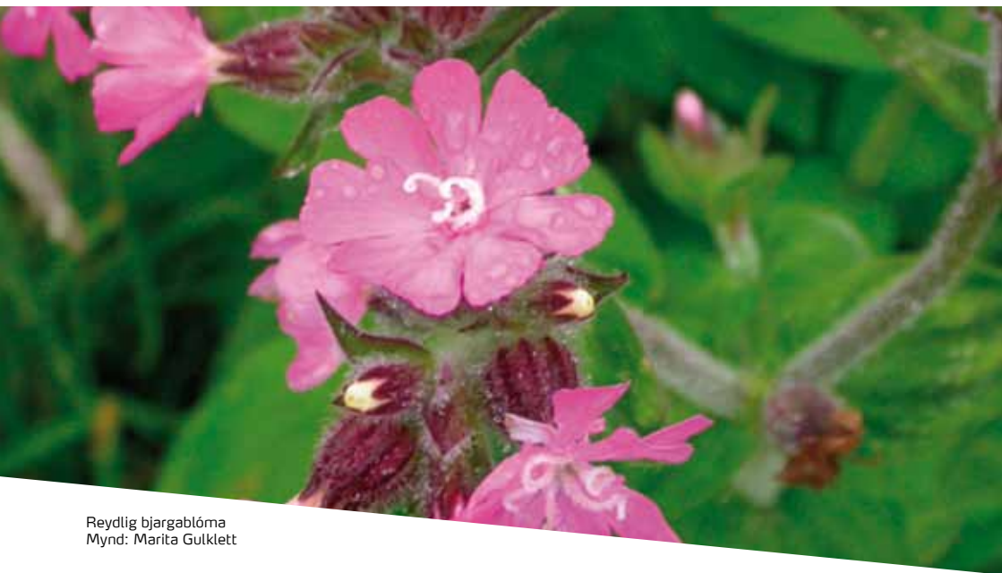
Reyðlig bjargablóma